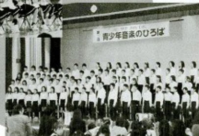
青少年音楽のひろば