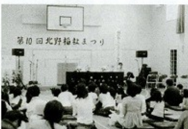
第10回北野福祉まつり