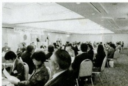
新札幌アークシテイホテル