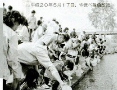
平成20年5月17日、やまべ稚魚放流