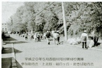
平成20年5月吉田川河川草刈り清掃 参加町内会・上北野・朝日ヶ丘・まきは町内会